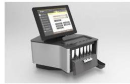
Vertriebseinheit Postauto Total ca. 3'500 Stk.