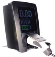
Autoladestation einige 1'000 Stk. p.a.