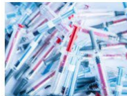
Medizinprodukte - Einweg mehrere 1'000'000 Stk. p.a.