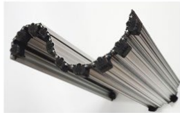
Komponenten Möbelindustrie Mehrere 10'000 Stk. p.a.